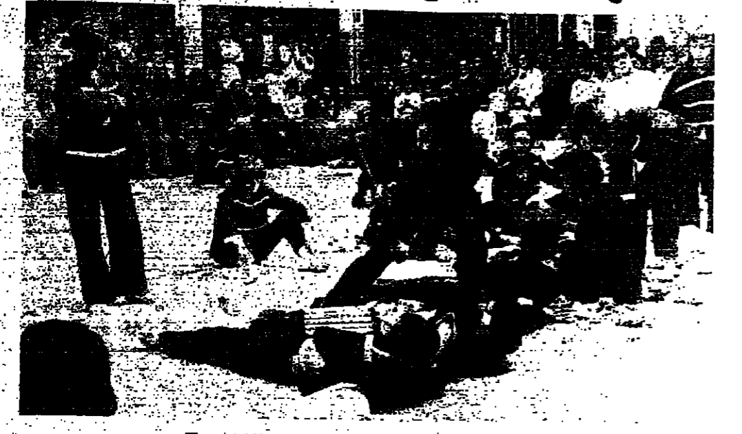
تصنع البلاط على يد بسون الطلاب